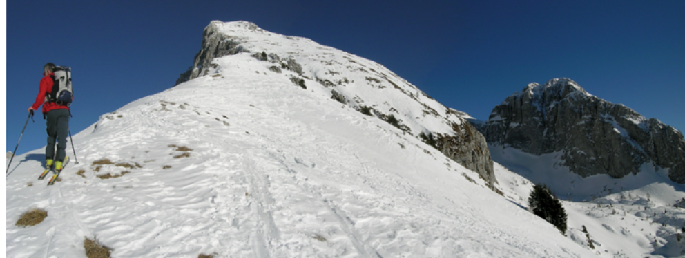
Prima di raggiungere il colletto

co nel recinto, si segue la forestale nella faggeta (sentiero 923) fino al cartello del bivio di quota 1430m. Qui si svolta a destra e si segue la mulattiera (ora più stretta) fino a giungere fuori dal bosco alla Casera Palantina (1521m). Sulla sinistra si nota, già imponente, l'ampio e ripido pendio sud, caratteristico del Cimon di Palantina. Per raggiungerlo è possibile rimontare, in modo accidentato, ma talvolta meno pericoloso, tutta la cresta sud (che parte in basso dal Col del Cuc). È tuttavia più